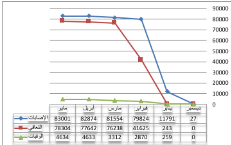
شكل 1 - مستوى الإصابات والتعافي والوفيات في الصين (World Health Organization, 2020)

يظهر الشكل 1 أن حالات الإصابة بالحمة التاجية في الصين بدأت في شهر ديسمبر من 2019، وكانت بمستوى منخفض بسبب حالة عدم اليقين حيال هذا النوع من الفيروسات، سواء لدى الصين أو دول العالم قاطبة من حيث التعرف إلى نوعه وخصائصه ومسبباته ونتائجه، وقد أدت حالة الجهالة في التعامل معه إلى ارتفاع كبير في معدلات الإصابة والوفيات في الصين خلال شهري يناير وفبراير حتى بدت الصين خلال هذه الفترة أنها عاجزة عن مقاومته والحد من انتشاره، لكن مع نهاية شهر فبراير تكونت لدى الصين الخبرة الكافية في التعامل مع معدلات الانتشار ومعرفة آليات انتقال عدوى الحمة التاجية، فأظهرت قدرة كبيرة في الحد